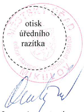
Bc. Ivana Augustová odborný zaměstnanec

Podané odvolání má v souladu s ustanovením § 85 odst. 1 správního řádu odkladný účinek. Odvolání jen proti odůvodnění rozhodnutí je podle § 82 odst. 1 správního řádu nepřipustné.